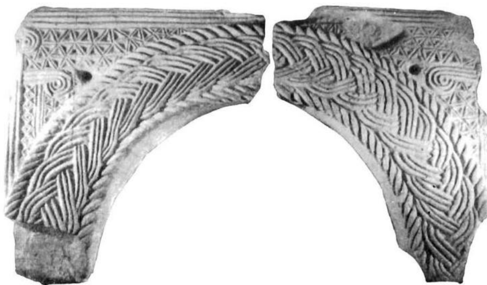
Rogačići, dijelovi ciborija Rogačići, part of ciborium